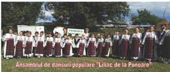
Ansamblul de dansuri populare „Liliac de la Ponoare”