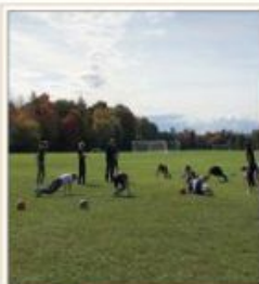
Lumea în care trăim pagina 4 - 5

Its size, combined with its proximity to the major urban centres of Toronto and Ottawa, makes Algonquin one of the most popular provincial parks in the province and the country. Highway 60 runs through the south end of the park, while the Trans-Canada Highway bypasses it to the north. Over 2,400 lakes and 1,200 kilometres of streams and rivers are located within the park.