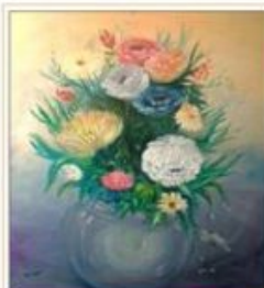
Lumea cu artă pagina 16 - 17