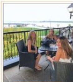
Lumea cu prietenie pagina 6 - 7